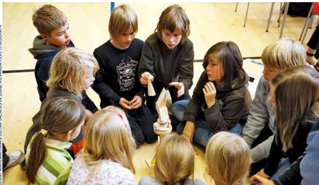
KUVAT MATEMATIIKAN OLYMPIALAISISTA 2009.